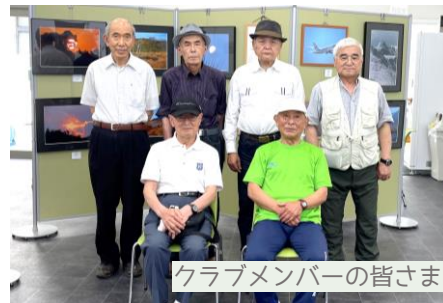
クラブメンバーの皆さま

6月2日から6月30日までコミプラロビーにおいて『白井市写真クラブ』様による【リレー写真展】が開催されました。圧巻の作品の数々に思わずため息がこぼれました。今後のご活躍が今から楽しみです!