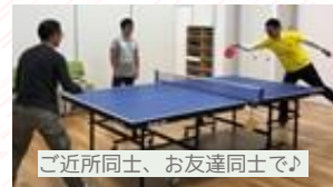
「ご近所同士、お友達同士で♪」

【利用時持物】ラケット・ボール・室内シューズ・消毒用布巾（アルコール消毒は貸出します）