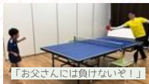
「お父さんには負けないぞ！」