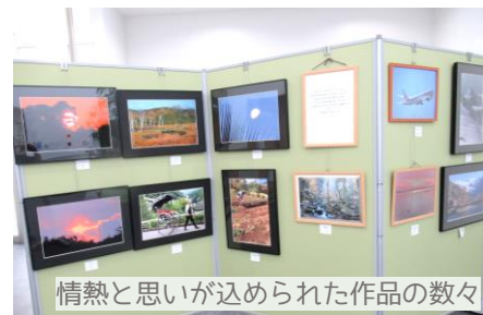
情熱と思いが込められた作品の数々