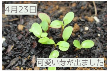
可愛い芽が出ました