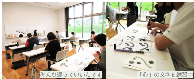
みんな違っていいんです

6月6日(日)に『己書体験幸座』を開催しました。特別な道具は使わずに濃淡の筆ペンだけで自由に描くことができる己書に興味を持たれる方は多く、今回の幸座も大盛況でした。描く文字すべてが大正解♪自身の作品に皆さん大満足のご様子でした。