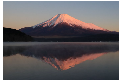
寒さのなかで朝の新鮮な空気とみる富士山は最高🍷