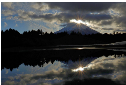
雲があるものの湖面の反射が◎

ダイヤモンド富士の撮影後、車で移動していると素敵な撮影スポットを発見。カメラの設定を細かく教えてくれるカメラの大先輩のおかげで、すこしづつ良い写真が撮れるようになってきた。