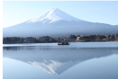
屋形船が宝船のように見える。縁起がよさそうで職員🍷のお気に入りの1枚

ダイヤモンド富士の撮影後、車で移動していると素敵な撮影スポットを発見。カメラの設定を細かく教えてくれるカメラの大先輩のおかげで、すこしづつ良い写真が撮れるようになってきた。