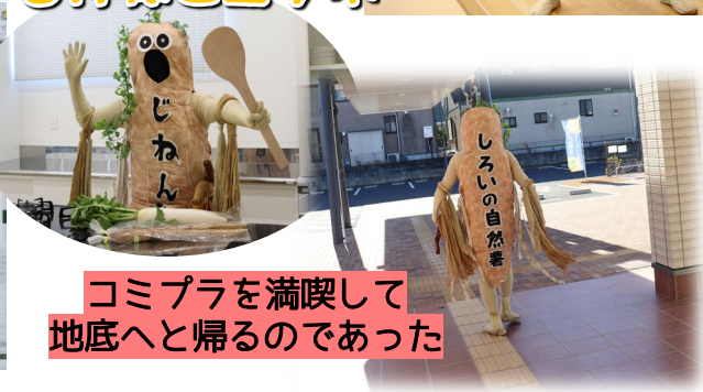
コミプラを満喫して 地底へと帰るのであった