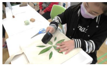
とにかく葉っぱを叩きます!!