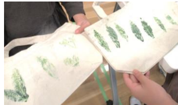
素敵なバッグの完成です♪