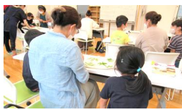
レイアウト相談中

8月15日(日)に『藍の生葉染め体験講座』を開催しました。種から育てたタデアイの葉を使って、世界にひとつだけのトートバッグが完成しました♪