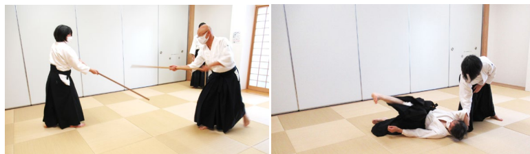
杖を使つての稽古