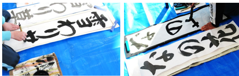
一筆一筆集中します

1月5日(水)に【書き初め教室】を開催しました。冬休みの定番である書き初めを、講師の方々のご指導のもと練習を重ね、見事に書き上げました。